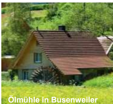
Ölmühle in Busenweiler