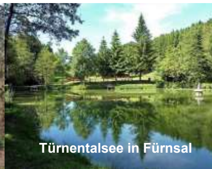
Türnentalsee in Fürnsal