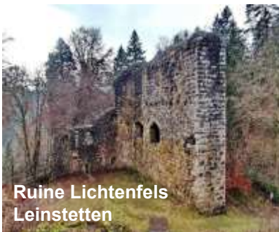
Ruine Lichtenfels Leinstetten

idyllisch • lebendig • attraktiv • vielfältig • kulturell